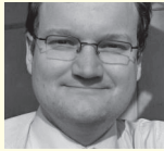
Klaus Teizer Vollack Gruppe GmbH & Co. KG