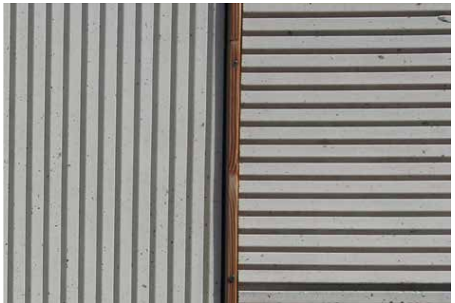
Platten aus Holzleichtbeton: Plattenförmige Bauteile aus Holzleichtbeton bieten funktional wie konstruktiv attraktive Leistungsmerkmale und gestalterisch anspruchsvolle Oberflächen.

An der Technischen Hochschule Nürnberg werden seit einigen Jahren die Zusammensetzung von Holzleichtbeton sowie dessen baukonstruktive Kenndaten auch hinsichtlich der Ressourceneffizienz erforscht. Zum Forschungsprojekt gehören Untersuchungsreihen zur Herstellung von Holzleichtbetonplatten und zu ihrer Anbringung an Fassaden unter praxisnahen Bedingungen. Fallstudien an Bauwerken sollen Aufschluss über die Gebrauchstauglichkeit und die Dauerhaftigkeit geben.