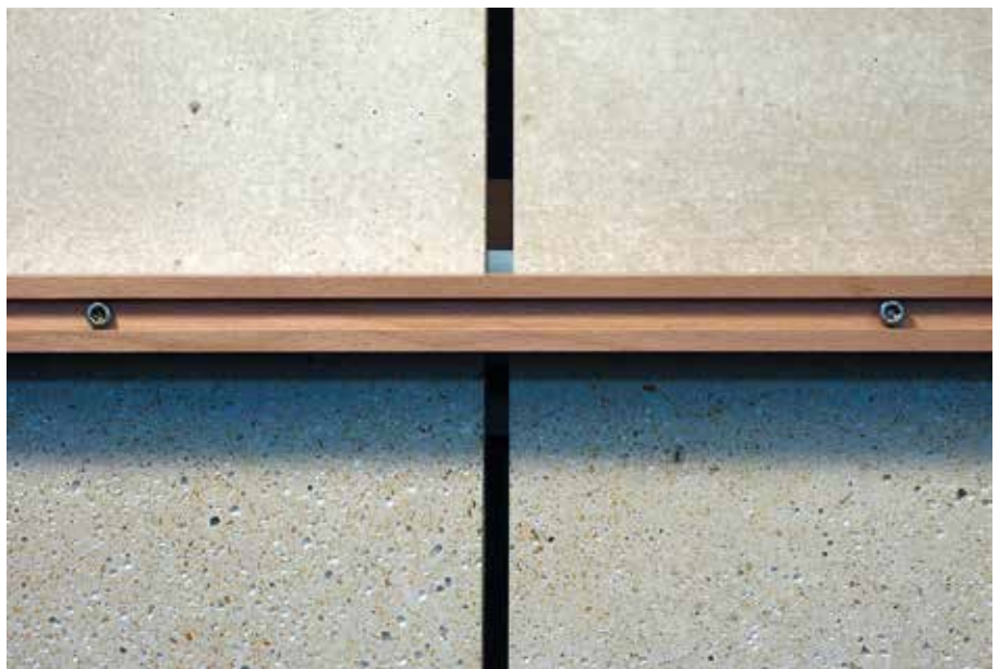
Musterkästen aus Holzleichtbeton mit unterschiedlichen Oberflächen und Befestigungen

Holzleichtbeton: Biegezugversuch an unbewehrtem Plattenstreifen mit den Abmessungen L/B/D = 500 \text{ mm}/100 \text{ mm}/20 \text{ mm}