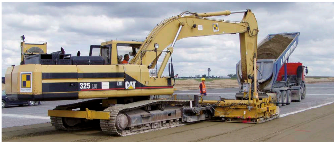
Bild 1: Einbau einer hydraulisch gebundenen Tragschicht mit Multi-Talent

Im Baumischverfahren wird dem zur Verfestigung vorgesehenen und verdichteten Boden oder Baustoffgemisch an Ort und Stelle die erforderliche Bindemittelmenge mit einer Fräse zugemischt. Das Bindemittel wird mittels eines Zementstreugeräts mit guter Dosiereinrichtung ausgestreut und nachfolgend untergemischt. Noch fehlendes Wasser ist erst nach dem ersten Mischgang oder bei Eingangsmischern während des Mischgangs zuzugeben. Die Wasserzugabe erfolgt entweder durch Wassersprengwagen oder durch einen