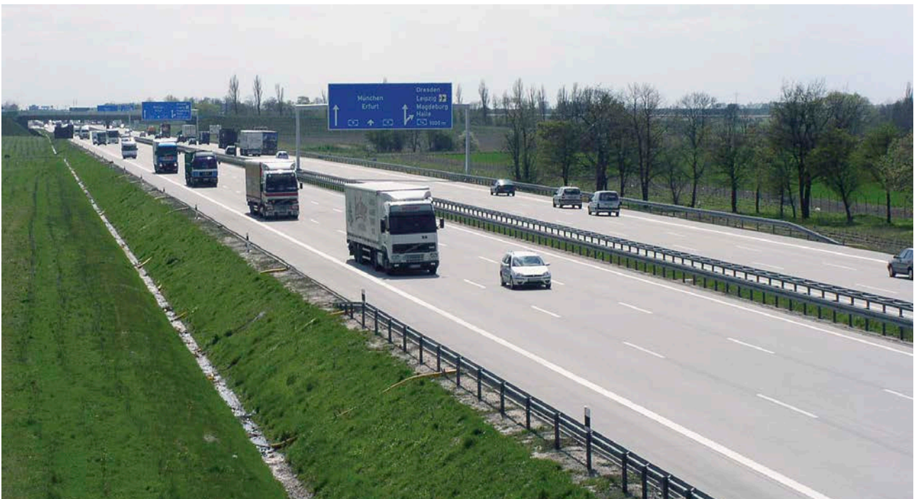
Bild 1: Betonfahrbahndecken sind auch bei hohen Belastungen dauerhaft.

Hydraulisch gebundene Tragschichten (HGT) bestehen aus ungebrochenen und/oder gebrochenen Gesteinskörnungsgemischen und hydraulischen Bindemitteln.