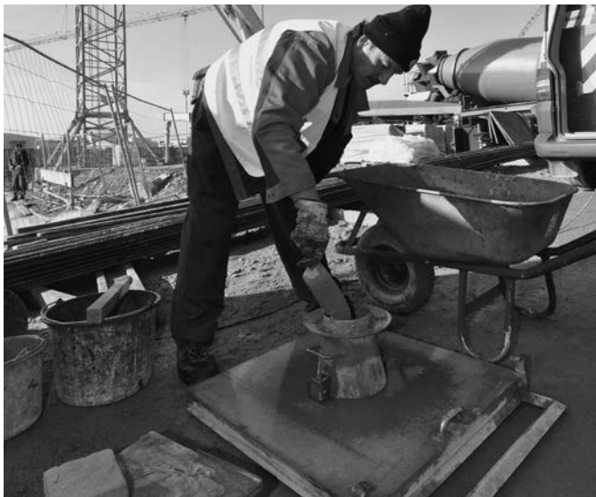
Bild 2: Auf der Baustelle wird u. a. die Frischbetonkonsistenz geprüft.