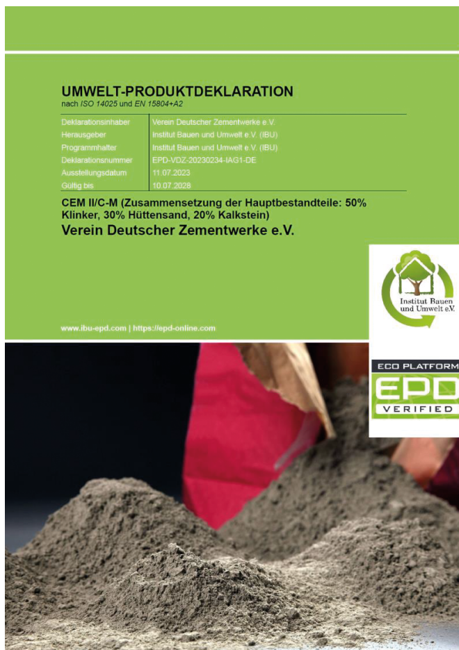
Bild 2: Umweltproduktdeklaration (EPD) eines CEM II/C-M mit Hüttensand und Kalkstein als weitere Hauptbestandteile

Allgemeines Rundschreiben Straßenbau Nr. 04/2022 (ARS 04/2022), Bundesministerium für Digitales und Verkehr, Februar 2022