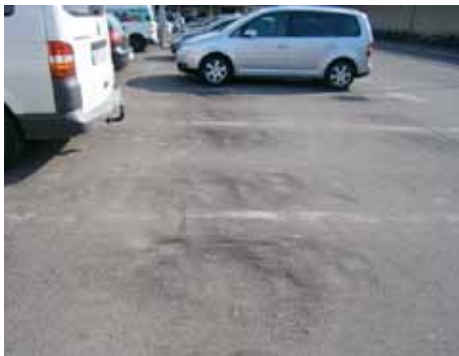
Verdrückungen, punktuelle Eindrückungen

Neben- und Rastanlagen, Industrie- und Lagerflächen.