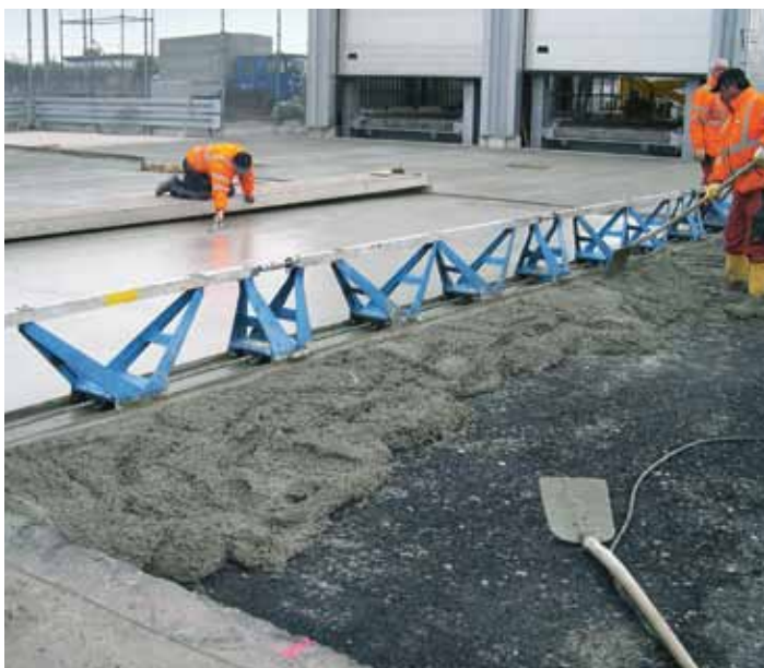
Betoneinbau mit Rüttelbohle