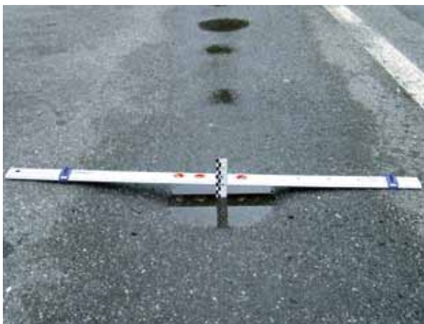
Asphaltstraße mit Verformungen/Spurrinnen

Der Zustand und die Schichtdicken des vorhandenen Oberbaus können anhand von Bohrkernen, allenfalls ergänzt durch Mischgutuntersuchungen, Tragfähigkeitsmessungen und Bestandsunterlagen, ermittelt werden.