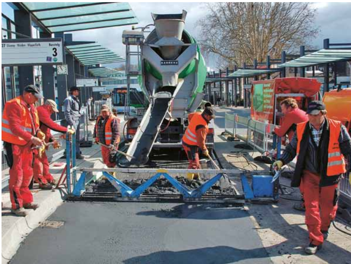
Handeinbau mit Rüttelflasche und Rüttelbohle