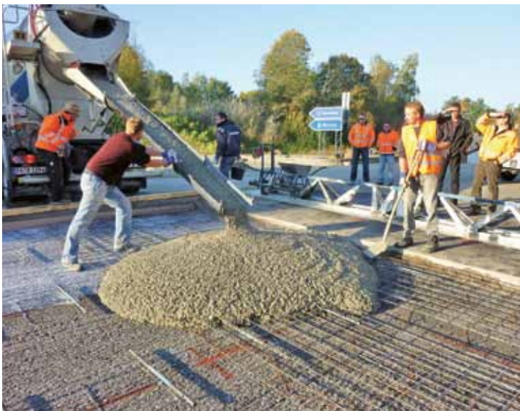
Handeinbau mit Rüttelbohle