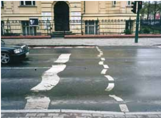
Verformungen im Bereich einer Signalanlage

Autobahnen, Bundesstraßen, Landes- und Stadtstraßen, überörtliches und zwischengemeindliches Straßennetz, Erschließungsstraßen, Privatstraßen – insbesondere im Bereich von Signalanlagen und Abbiegespuren.