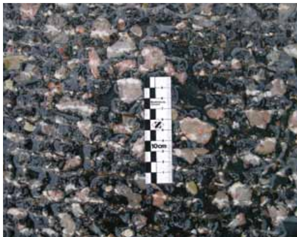
gefräste, gereinigte Asphaltfläche

Bei erhöhter Schubbeanspruchung oder großen Längskräften sind am Übergang zwischen Beton und Asphalt verstärkte Endfelder zu empfehlen.