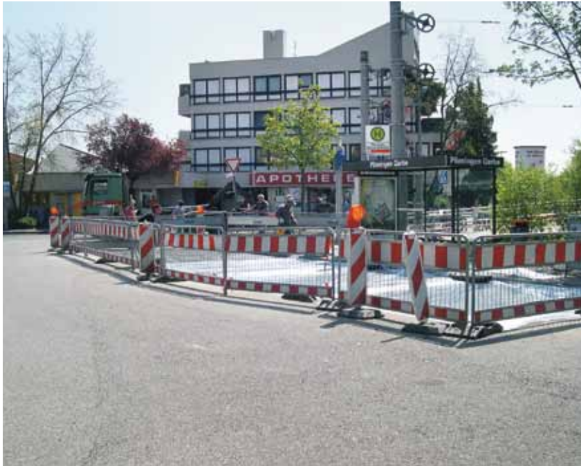
Baustellensicherung mit Schutzzaun