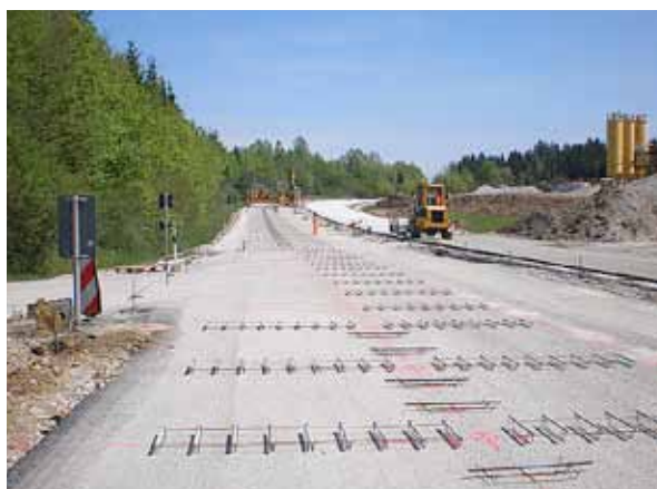
verlegte Dübel und Anker auf vorbereiteter Unterlage

In Fällen mit hohen Beanspruchungen – beispielsweise bei hohen Schub- und/oder Radialkräften – ist es zweckmäßig, die Fugen zu verdübeln und zu verankern. Dabei ist zu beachten, dass Platten erst ab einer Dicke von 12 cm verdübelt bzw. verankert werden können. Der Dübelabstand beträgt 25 cm. Bei einem Fugenabstand von < 2 m sind zwei Anker pro Platte ausreichend.