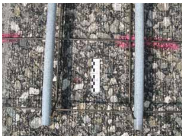
gefräste Unterlage mit Dübel auf Unterstützungskorb im Detail