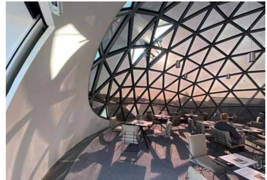
Niemeyerkugel innen

Flüge ab/bis Wunschflughafen, Shuttle Airport-Hotel-Airport, Verlängerung des Aufenthalts