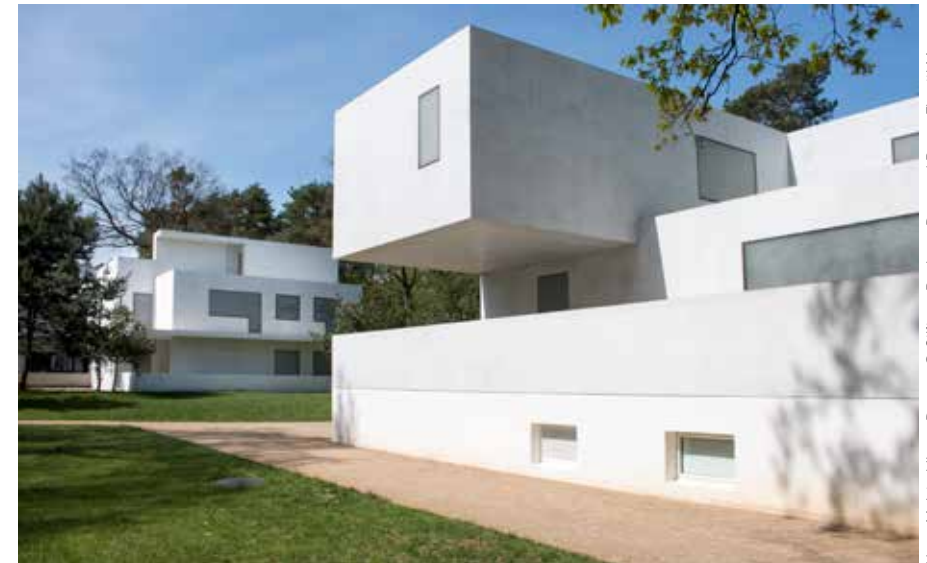
Neue Meisterhäuser Dessau