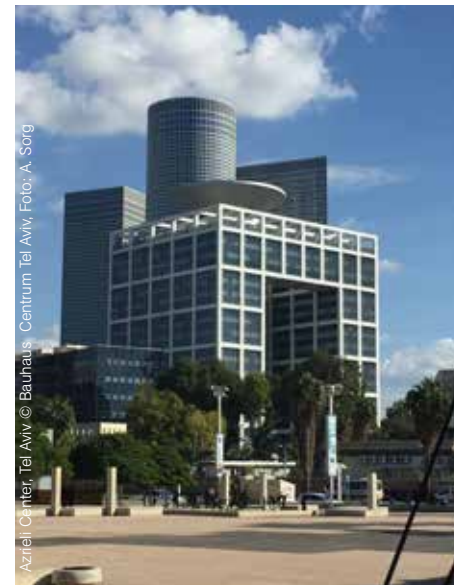
Azrieli Center, Tel Aviv © Bauhaus - Centrum Tel Aviv, Foto: A. Sorg