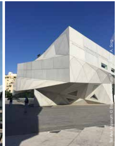
Tel Aviv Museum © Bauhaus - Centrum Tel Aviv, Foto: A. Sorg