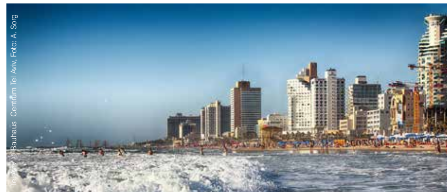
Tel Aviv © Bauhaus - Centium Tel Aviv, Foto: A. Soig