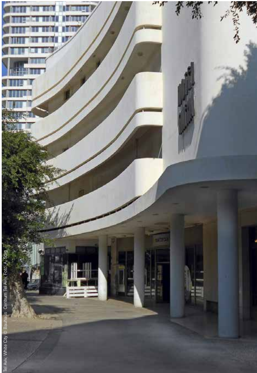
Tel Aviv, White City