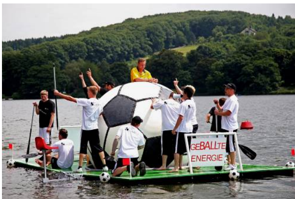
In der offenen Klasse belegte das Team der Hochschule Lausitz den ersten Platz.