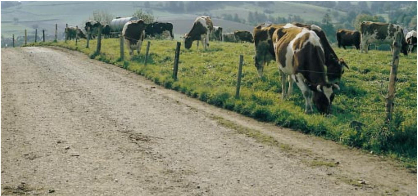
Bild 9: Naturnaher Weg mit hydraulisch gebundener Tragdeckschicht (HGTD)

Hydraulisch gebundene Tragdeckschichten sind gut befahrbar. Sie eignen sich besonders für ländliche Wege, die sowohl hohen Verkehrslasten ausgesetzt sind als auch verstärkter natürlicher Erosion unterliegen wie in Gefällestrecken. Solche Wege in „verbesserter Schotterbauweise“ werden aufgrund ihrer festen und ebenen Oberfläche gerne auch von Spaziergängern, Wanderern und Radfahrern angenommen. Bei entsprechender Kornzusammensetzung sind sie auch für den Viehtrieb (keine Klauenverletzungen) geeignet (Bild 9).