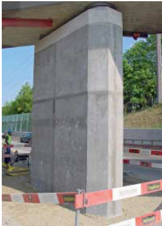
Fig. 2 Central support strengthened by UHPFRC elements.

Abb. 2 Mit UHFB-Elementen verstärkte Mittelstütze.